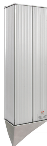
EPV 2LIFE 210 x 721 x 130 mm